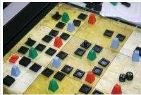
Schwarzes Gold

Spiele bildet. Oder hätte jemand auf Antrieb gewusst, wie das damals im Detail ablief, als zum ersten Mal Öl in zuvor nicht gekanntem Ausmaß gefunden wurde? Anfang des 20. Jahrhunderts war es. Auf dem Spindletop Hill, einem Hügel im Südosten Texas, der nach einem Baum benannt wurde, der wie ein umgekehrter Kegel gewachsen war. Eben. Nach dem Studium der Spielanleitung weiß man all das. Und auch noch anderes mehr. Für das Spiel selber sind solche Infos allerdings ohne direkten Belang. Aber sie sind durchaus interessant. Ausserdem helfen sie, die passende Ambiance zu schaffen für ein kleines, hübsches Strategiespiel in zwei Phasen. In der ersten werden die Ölfelder entdeckt und alles Nötige aufgebaut, das zur Förderung und zum Transport des Öls in Phase 2 benötigt wird.